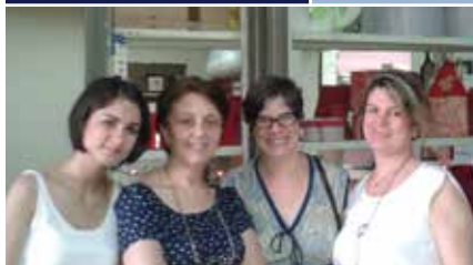
Les membres de la coopérative Likar, heureux de participer à cette recherche.

L'importante recherche de l'ACC a permis de documenter plus de 100 coopératives menées par des femmes en Turquie. Ce travail aide la Fondation pour l'appui au travail des femmes à raconter leur histoire de même qu'à défendre et à appuyer le développement des coopératives menées par des femmes dans tout le pays.