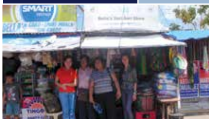
Reconstruction des magasins sari-sari à la suite du passage du typhon Haiyan.

L'ACC est engagée dans la reconstruction de micro-entreprises dirigées par des femmes, l'offre de formation en gestion et l'accès à la micro-assurance dans le contexte des dommages causés par le typhon Haiyan.