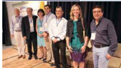
Rencontre entre les conférenciers invités, des représentants de l'ACC et le personnel de l'ambassade canadienne au Forum national.

Le projet IMPACT en Colombie a récemment franchi le cap d'une première année de travail avec 66 organisations productrices réparties dans onze départements du pays. Le premier forum national réunissant toutes les organisations productrices du projet IMPACT, tenu en octobre, a permis aux participants de faire du réseautage, d'apprendre les uns des autres et de se renseigner au sujet de la situation agricole nationale de même que des mouvements coopératifs colombiens et canadiens.